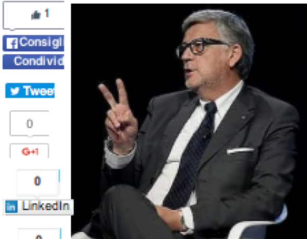
Francesco Pugliese, presidente di Adm

BOLOGNA - Al via "Marca2016", l'appuntamento annuale dedicato ai brand della Grande distribuzione organizzata. "La distribuzione sta evolvendo verso un modello nel quale la Responsabilità Sociale d'Impresa diventa un elemento strategico dal punto di vista economico, sociale e ambientale. Il prodotto con il brand dell'insegna è l'elemento più caratterizzante di questa evoluzione: non si tratta più di una "private label" dove il prezzo è la mera somma dei costi diretti, ma di una vera